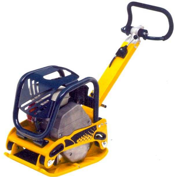
Bandeja compactadora reversible Ten.

Enarco ha participado recientemente en las ferias Saie y Batimat presentando sus últimas novedades de productos. En el Salón Internacional de Construcción celebrado en Bolonia (Saie), que tuvo lugar del 24 al 28 de octubre, la firma expuso sus tres líneas de producto: vibración, pavimentación y compactación en su stand ubicado en el Area 48, Stand A 76.