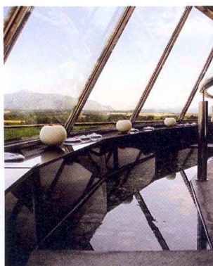
Freixanet estará en Piscina 2007