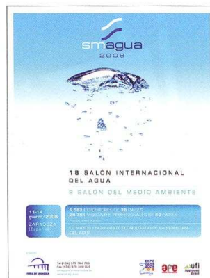
Cartel de la edición 2008 de Smagua

DP Feria de Zaragoza Feria de Zaragoza acogerá , entre el 11 y el 14 de marzo de 2008, la XVIII edición de Smagua, el Salón Internacional del Agua, y la VIII edición del Salón del Medio Ambiente. Por su marcado carácter innovador, ambos certámenes se han convertido en el encuentro comercial de referencia para los sectores del agua y del medio ambiente en el plano internacional.