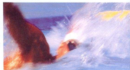
Acqua Silence resuelve el problema del ruido de las piscinas

DP Acieroid Acieroid , empresa especializada en servicios para el sector de la construcción, estará presente en Piscina 2007. La compañía exhibirá Acqua Silence, su último sistema constructivo, una solución para recintos cerrados con altos niveles de ruido y humedad. Desarrollada por el departamento técnico de la empresa, resuelve la problemática de grandes espacios acuáticos como polideportivos, gimnasios, balnearios urbanos o centros de salud. La nueva solución se integra en la propia cubierta o fachada para conseguir una instalación mucho más