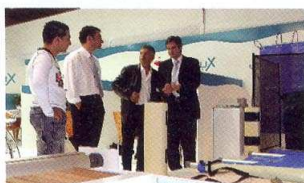
Edición 2005 de Piscina BCN

La oferta de Piscina BCN está organizada en 17 sectores especializados entre los que destacan, por cifra de empresas expositoras, piscinas; tratamiento físico y químico del agua; wellness , fitness , spas y bañeras