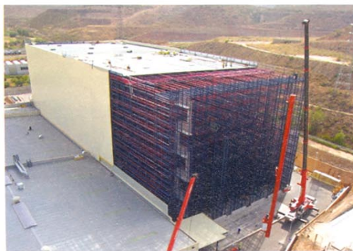
Silo de Becton Dickinson.

Asimismo, la feria apostará de forma decidida por agregar a las áreas de exposición otro tipo de actividades que fomenten el intercambio de opiniones y el enriquecimiento profesional de sus visitantes y expositores. En este contexto, adquieren protagonismo las jornadas técnicas, centradas en los temas de mayor interés para los distintos colectivos que componen el sector de la construcción, equipamiento e instalaciones y en las que participarán destacados ponentes de diferentes campos. En su última edición, Construlan registró una cifras de participación óptimas con un total de 547 empresas que ocuparon más de 40.000 metros cuadrados de superficie expositora.